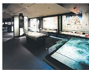
『真田太平記』の舞台を地 形模型と映像で紹介。

平成28年のNHK大河ドラマ「真田丸」の放送も決まり、ますます活気を帯びる信州上田。他にも多くの名湯や雄大な高原、懐かしい日本の原風景が広がる魅力たっぷりの上田のまちを訪れてみてはいかがでしょうか。