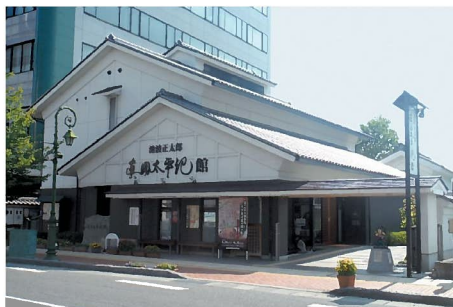
⑥池波正太郎真田太平記館

池波正太郎真田太平記館 住 所 ●〒386-0012 長野県上田市中央3丁目7番3号 電 話 ●0268-28-7100 入館料 ●大人300円、高・大学生200円 小・中学生100円 休館日は、毎週水曜日(水曜日が祝日の場 合は開館)と祝日の翌日・年末年始。