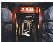
忍忍洞は「草の者」の世界 をからくり絵で楽しめる。

池波正太郎真田太平記館 住 所 ●〒386-0012 長野県上田市中央3丁目7番3号 電 話 ●0268-28-7100 入館料 ●大人300円、高・大学生200円 小・中学生100円 休館日は、毎週水曜日(水曜日が祝日の場 合は開館)と祝日の翌日・年末年始。